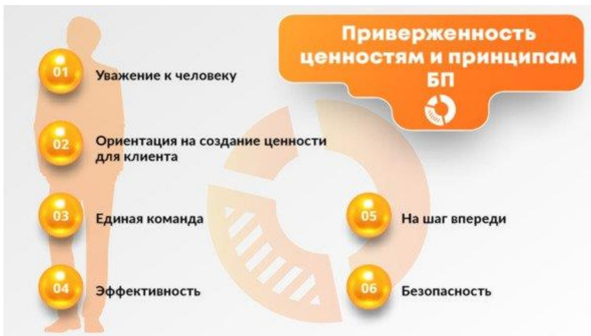
Рис. 3. Блок компетенций «Приверженность ценностям и принципам бережливого производства»