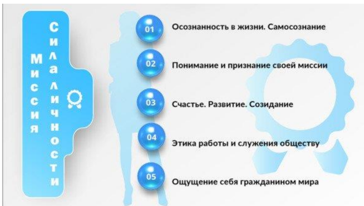
Рис. 2. Блок компетенций «Миссия. Сила личности»

Осознанность — это ориентация на настоящий момент времени, понимание своих целей здесь и сейчас, осознание своих мыслей и действий. В свою очередь, самосознание — осознание и оценка человеком самого себя, своих интересов, ценностей, идеалов и мотивов поведения. Осознанность в бережливом производстве означает, что человек понимает, как его действия влияют на достижение целей организации, а также на потребности и ценности клиента, и действует исходя из ценностей и идеалов бережливого производства, применяя методы, необходимые для достижения целей.