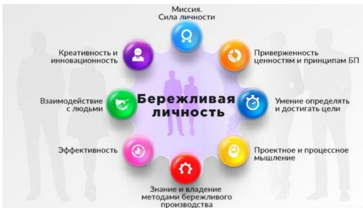
Рис. 1. Модель компетенций бережливой личности

В модели компетенций бережливой личности особое внимание уделено мировоззренческим и ценностным вопросам развития личности, особенностям мышления, а также конкретным навыкам в области методов и инструментов бережливого производства.