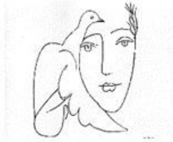
· Пабло Пикассо «Голубь мира»

31. Какими выразительными средствами изобразил художник свою мысль?